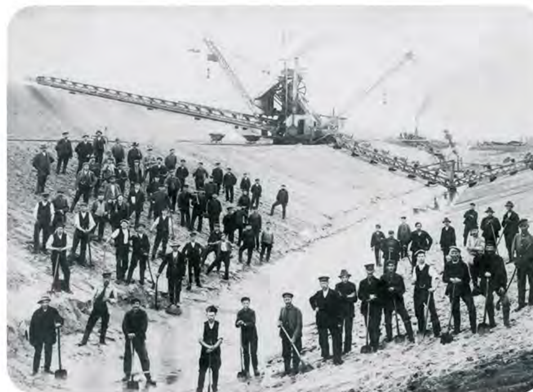
Bau der Hohensaaten-Friedrichsthaler-Wasserstraße nördlich von Schwedt/Oder, 1913

Das untere Odertal ist eine sich über 60 Kilometer erstreckende Flussniederung zwischen Hohensaaten im Süden und Szczecin (Stettin) im Norden. Die fast 10.000jährige Geschichte dieses Tals reicht bis in das Pommernstadium der Weichseleiszeit zurück. Die drei bis fünf Kilometer breite Niederung wird von Grund- und Endmoränen bzw. Talsandterrassen gesäumt. Das in den Jahren 1906 bis 1928 nach holländischem Vorbild errichtete Poldersystem sorgt trotz Flussbegradigung und Deichbau besonders im Winter und Frühjahr für langanhaltende Überflutungen in der Aue. Die Flutungspolder fassen bis zu 130 Mio. Kubikmeter Wasser. Sie vergrößern bei geöffneten Bauwerken das Abflussprofil der Oder.