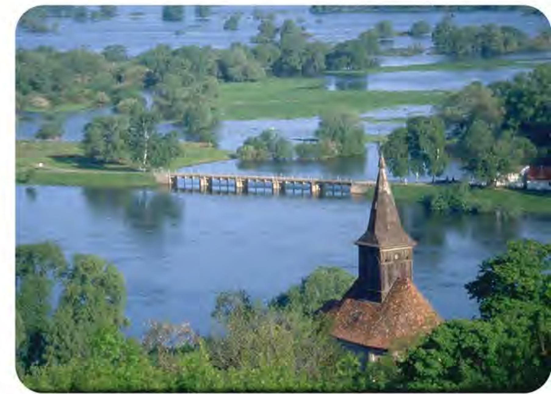
Saathener Wehr an der Oder, Polder A/B

Die über viele Jahre von ehrenamtlichen Ornithologinnen und Ornithologen gesammelten Daten zur Vogelwelt führten bereits 1980 zur Ausweisung ausgedehnter Polderflächen als Feuchtgebiet von internationaler Bedeutung (FIB).